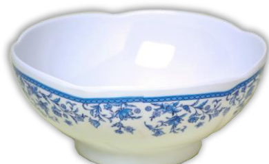
品番：57458 JAN:4571140739663 ボウル φ13/H6 容量350ml 本体価格¥200 カートン入数108