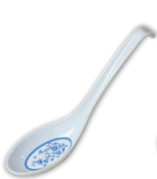
品番：57445 JAN:4571140739533 レンゲ W4.5/L16.5 本体価格¥60 カートン入数144