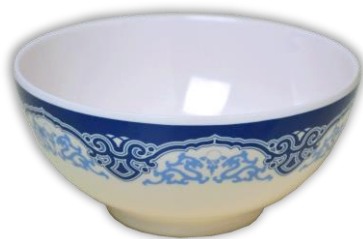
品番：57468 JAN:4571140739762 ボウル φ12/H5.5 容量200ml 本体価格¥180 カートン入数120