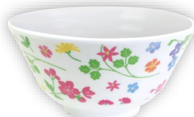
品番：57395* JAN:4571140736372 ボウル φ12/H6 容量320ml 耐熱温度：100℃ 本体価格¥480 カートン入数120