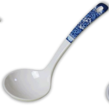
品番：57460 JAN:4571140739687 お玉 W6/L18 本体価格¥90 カートン入数96