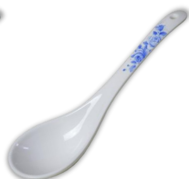
品番：57470 JAN:4571140739786 お玉 W6.5/L22 本体価格¥150 カートン入数144