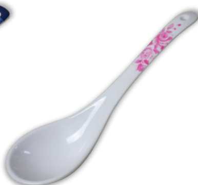
品番：57469 JAN:4571140739779 お玉 W6.5/L22 本体価格¥150 カートン入数144